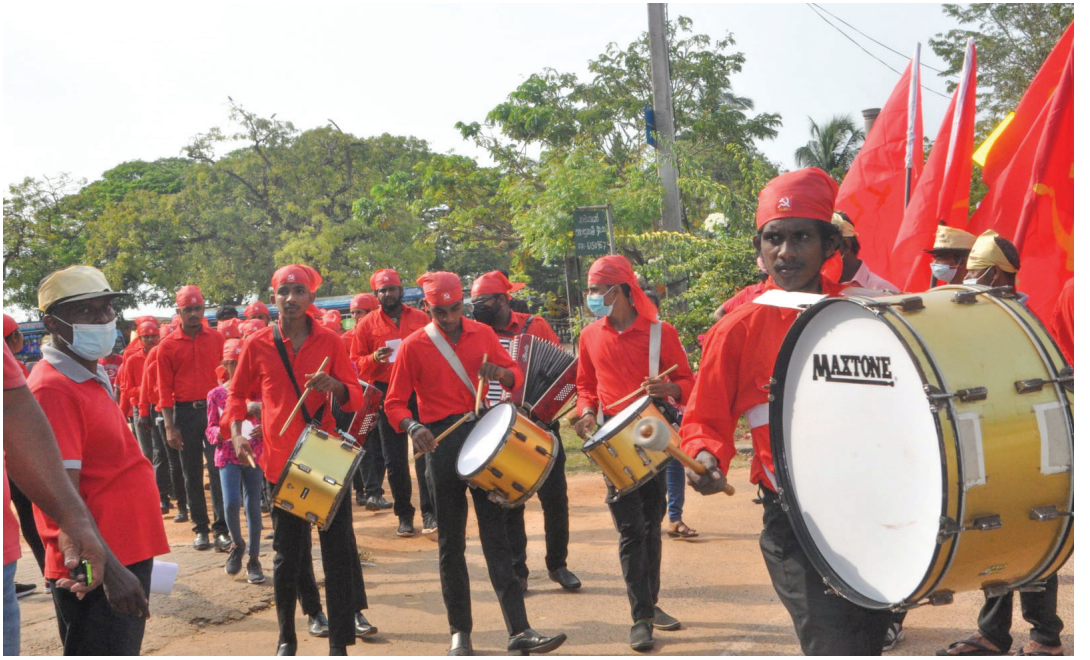
සමරු ආචාර පෙළපාලියේ කුර්ස වාදක කණ්ඩායම...