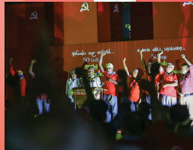
සමාජවාදී විප්ලවයේ ජයග්‍රහණය වෙනුවෙන් ...

1971 අප්‍රේල් අරගලයේ 50 වැනි සමරුව වෙනුවෙන් පෙ.ස.ප. විසින් අප්‍රේල් 5 වැනිදා කිස්මහරාමයේ පැවැත්වූ සමරු වැඩසටහනේ අවස්ථා