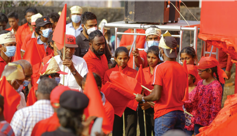
සමරුවට එක්වූ පරම්පරා තුනක්...