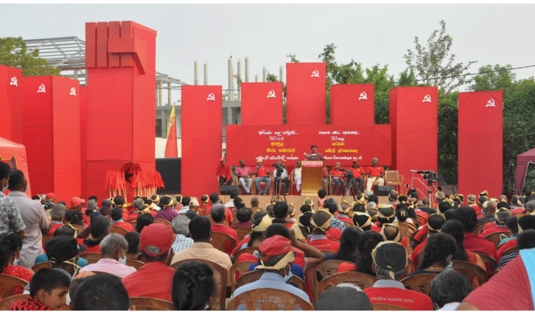
1971 අප්‍රේල් අරගලය, 50 වැනි සමරු භූමිය

පෙරටුගාමී සමාජවාදී පක්ෂයේ මධ්‍යම පුවත්පත 2021 මැයි