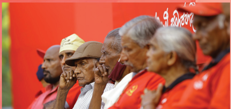
සමරු වේදිකාවේ 71 පරපුර නියෝජනය කරමින් ...