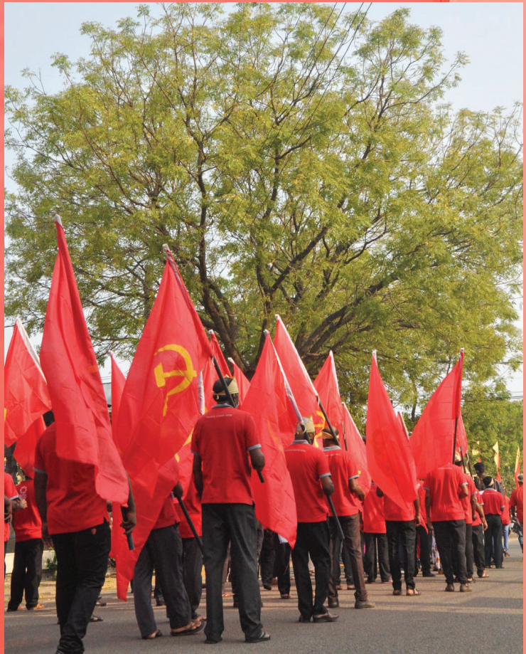
සමරු ආචාර පෙළපාලිය ඉදිරියට ඇදෙයි.....