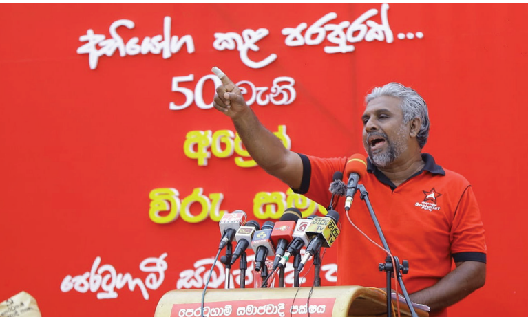
වමර කොස්වත්ත සහෝදරයා, සමරු දේශනය ඉදිරිපත් කරමින්...