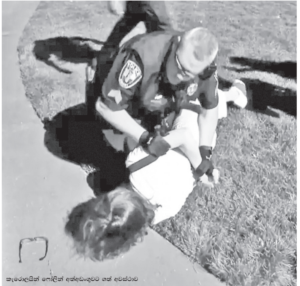
කැරොලයින් ෆෝලින් අත්අඩංගුවට ගත් අවස්ථාව